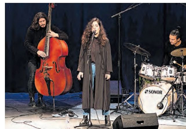
Braschler/Fischer: Fotografien, die Geschichten erzählen.