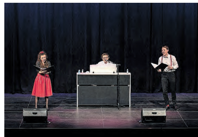
Was wir aktuell nicht dürfen, ist in der Musik möglich: «walk in the park, kiss in the dark and a sailboat ride». Trio RoSaTo mit dem Song «Things» von Nancy Sinatra.